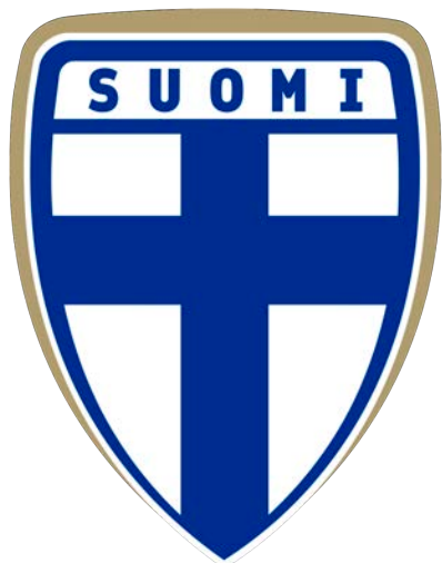
VILLE SKINNARI KAPITÄN, FINNLAND